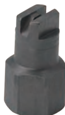
1/8" 到 1/4" NPT 或 BSPT (F)