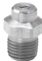
碳化钨喷孔嵌体 1/4" NPT 或 BSPT (M)