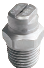
1/8" 到 1/4" NPT 或 BSPT (M)